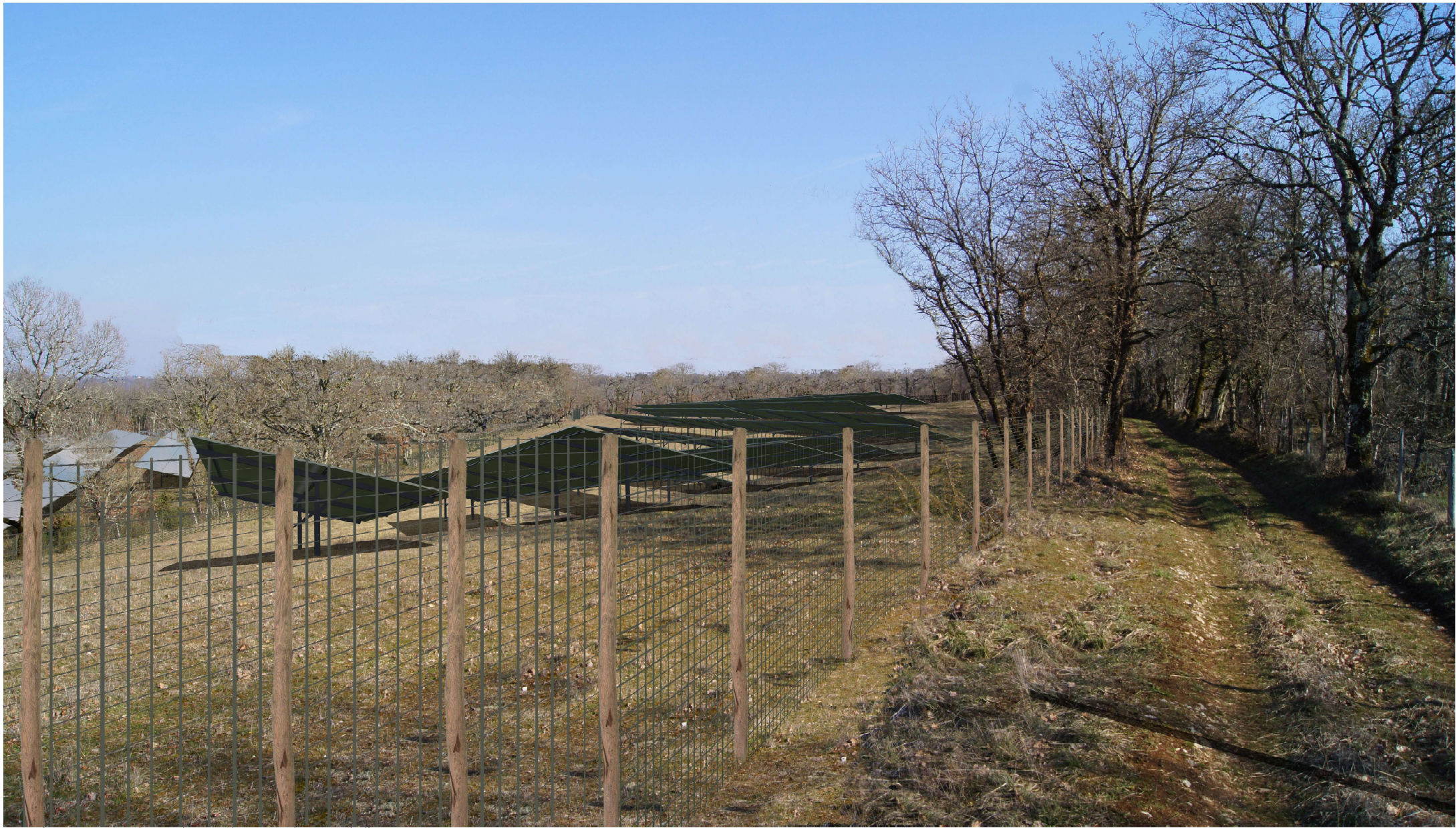
Point de vue n°4 - situé au sud-ouest du site en direction de l'est