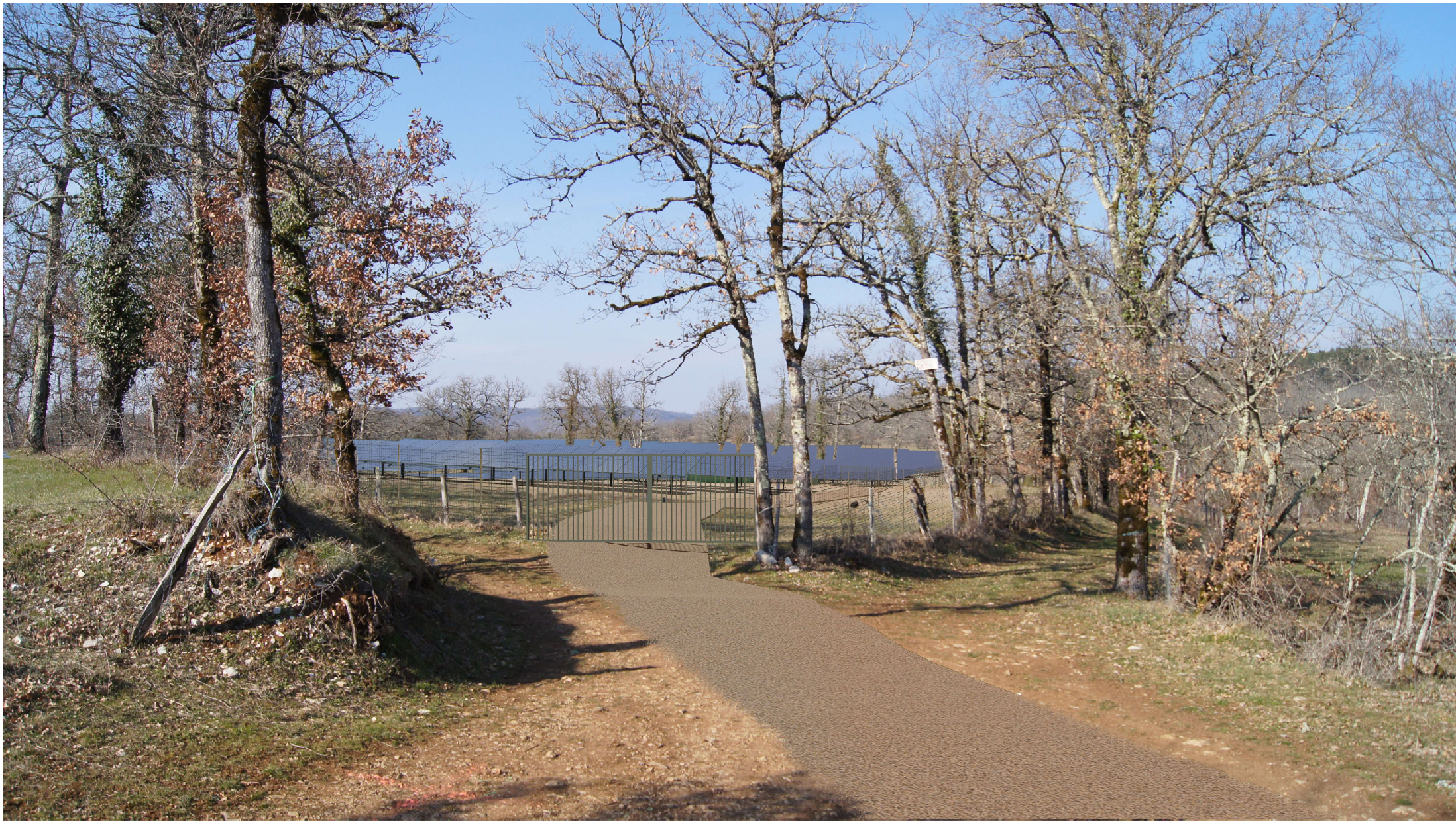
Point de vue n°1 - situé au niveau de l'accès sud du site en direction du nord