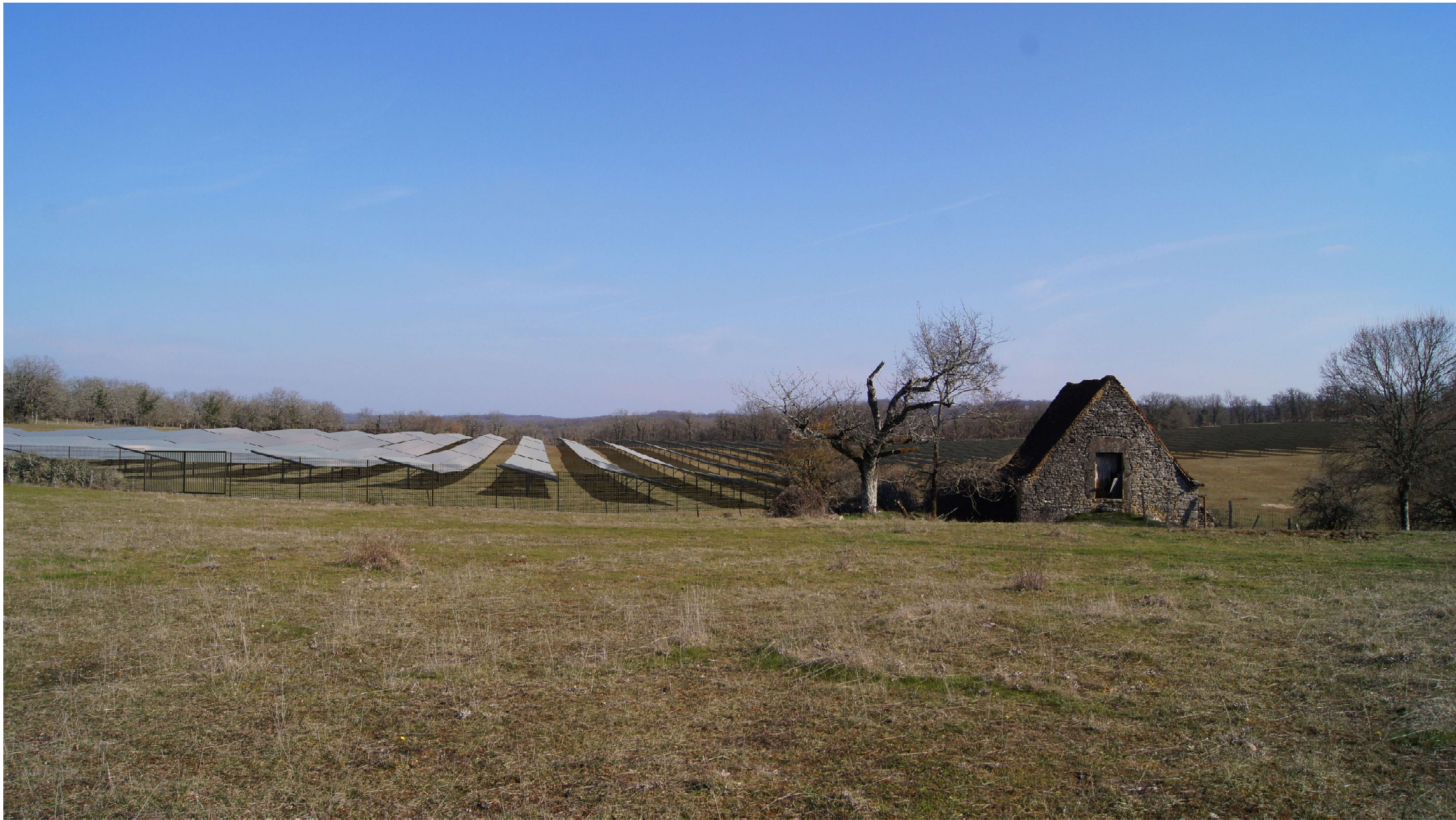
Point de vue n°3 - situé à l'ouest du projet en direction de l'est