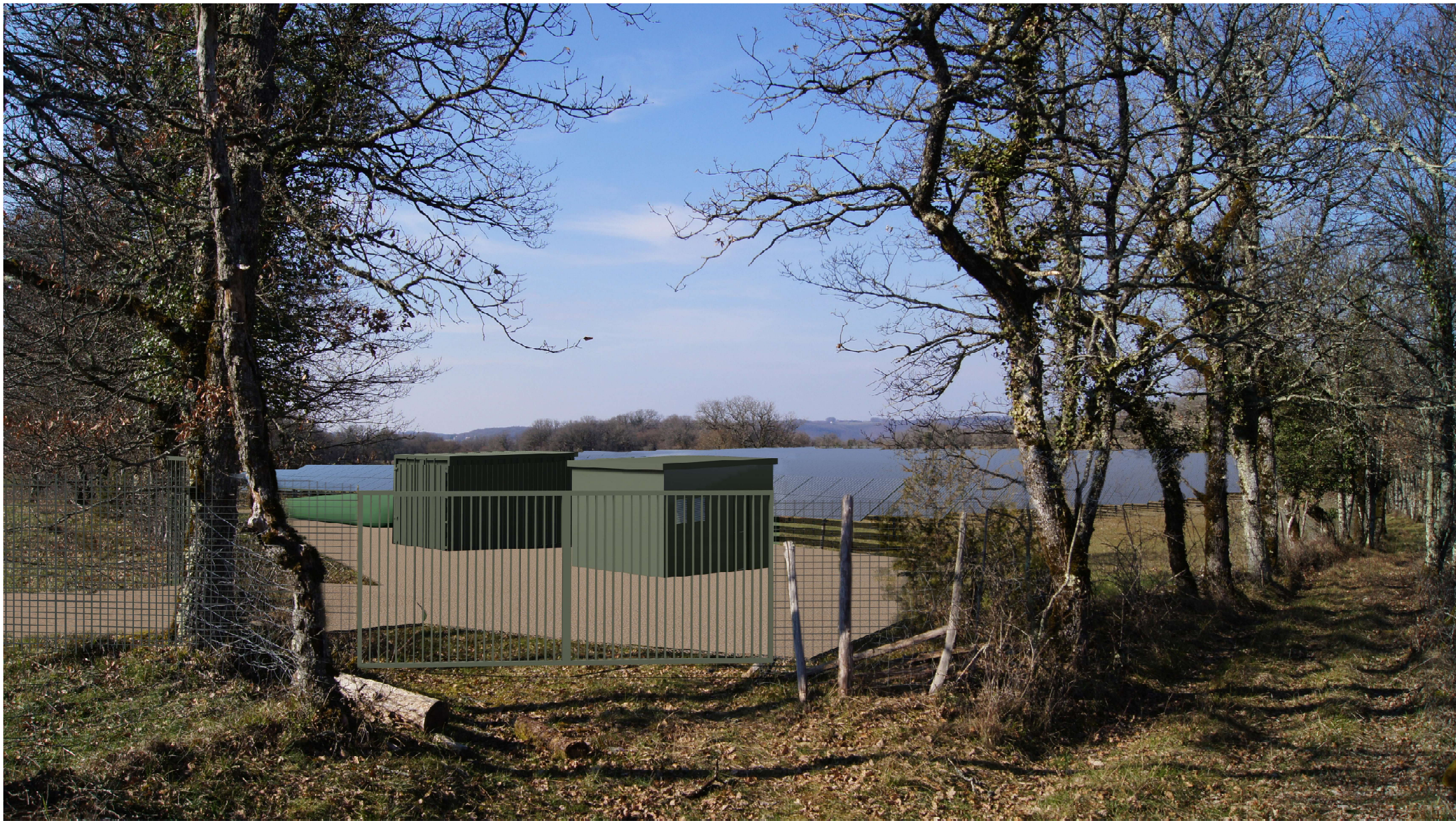
Point de vue n°2 - situé au sud-est du site en direction du nord-ouest